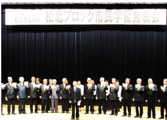
清吟堂吟友会 松江ブロック