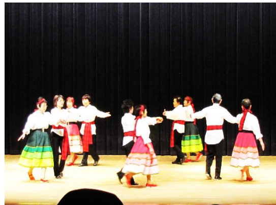
生馬フォークダンス教室