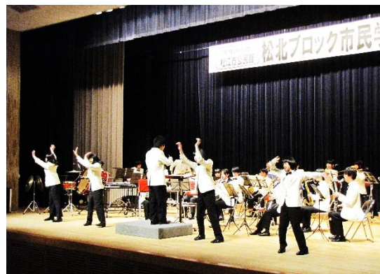
【オープニング】松江高専 吹奏楽部のみなさん