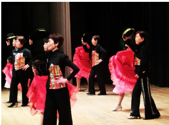
ジャストスマイル [ラウンドダンス]