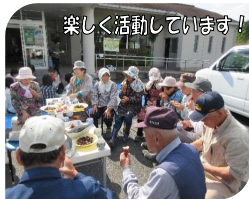
楽しく活動しています!

一緒に活動して親睦の輪を広げていきたいと思っておりますので、たくさんの方が入会されますことを心からお待ち申し上げます。