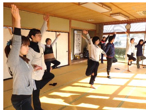
2月おやまっこ「ヨガ教室(2回目)」