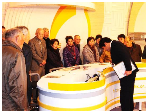
2月 寿会 第2回地域探訪「NHK 見学」