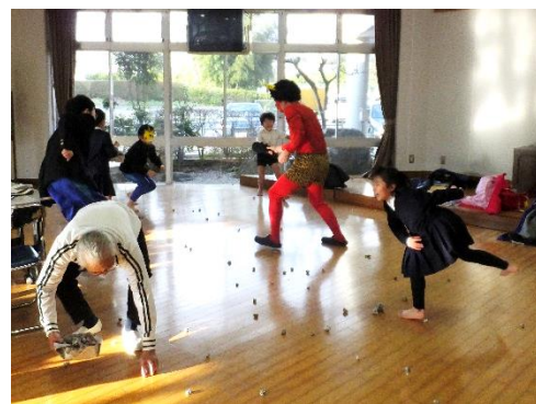
2/2(月)鬼の登場に怖がる子もいましたが、元気いっぱい豆まきをしました!