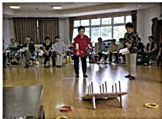
初めての「輪投げ大会」