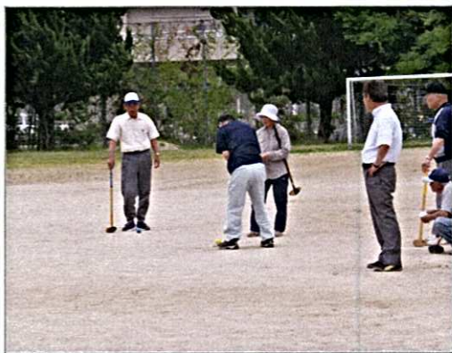
「グラウンドゴルフ大会」