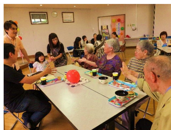
園児とジャンケンを楽しむ皆さん!