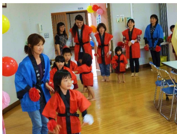
生馬幼稚園児と保護者が踊った「生馬音頭」!