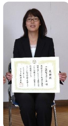
下佐陀町下子ども会 (団体受賞)