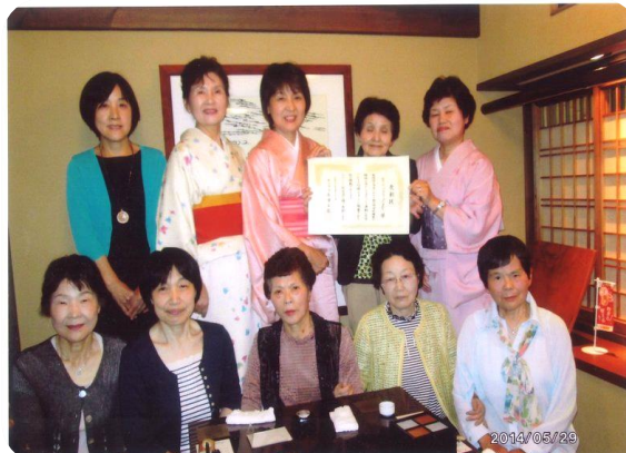
ボランティアグループひまわり 様 (団体受賞)