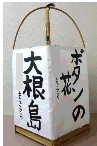
(書道による作品例)