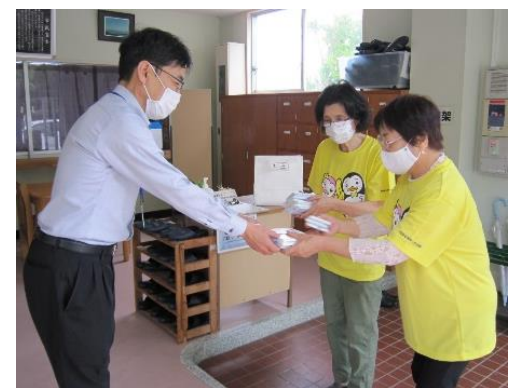
(本庄中学校へ贈呈の様子)

7月は「社会を明るくする運動」の 強調月間・再犯防止啓発月間です。 本庄地区更生保護女性会では、この 活動への理解を深め、安全安心な明 るい本庄となることを願い、毎年、 街頭での活動を行っています。今年 は、コロナ禍のため街頭活動をやめ、 7月3日に本庄幼稚園・保育所・小 学校・中学校へ啓発ポケットティッ シュを贈呈しました。