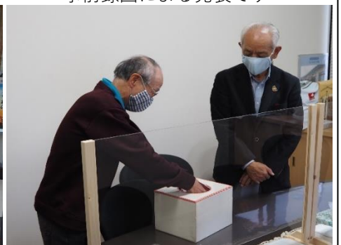
QUOカードの抽選会の様子