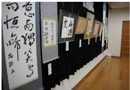
どの作品も目を見張る力作揃いでした