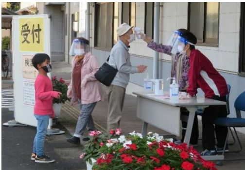
受付で検温・消毒をしっかりと行います

なお、ご来場名簿作成にご協力いただきました中から、厳選な抽選を行い50名の方々にQUOカードをプレゼントいたしました。発表は発送をもってかえさせていただいております。ありがとうございました。