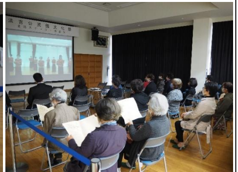
文化教室の発表は 事前録画による発表です