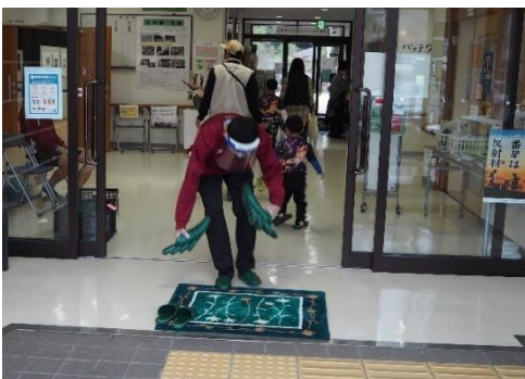
一中生ボランティアも活躍しました