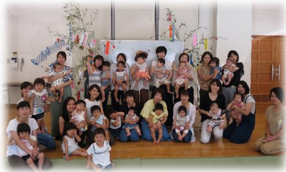
昨年度のひよこ学級 七夕会の様子