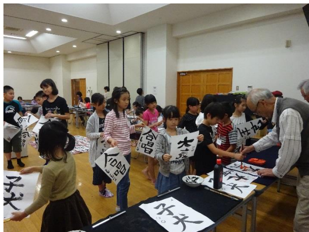
(子ども広場 書道の様子)