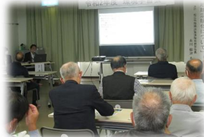
主催 朝酌公民館環境部

当日は20名の参加がありました。今回の学習会をきっかけに朝酌地区で環境問題への関心がさらに高まることを期待します。