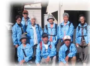
健康まつえ 21 朝酌健康推進隊

10月16日(金)に八束地区健康まつえ 21 推進隊主催のノルディックウォーキング教室へ招待していただき、朝酌健康推進隊は10名で参加してきました。当日は快晴でウォーキング日和となりました。