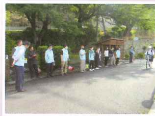
登校見守りパトロール

今後、数年ぶりに開催される夏祭りを皮切りに朝酌文化祭等の地域行事、さらに育成協議会の行事、二中PTA活動の立ち当番への参加等を行っていきますのでご協力をよろしくお願い申し上げ、就任のご挨拶といたします。