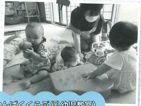
わんぱくくらぶ(乳幼児教室)