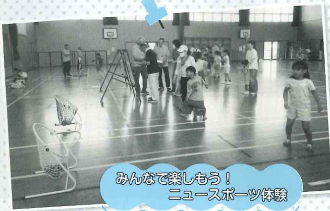
みんなで楽しもう！ ニュースポーツ体験