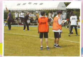
運動会 中学生ボランティア