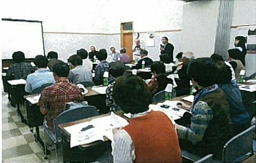
—視察研修での意見交換会—

午後は、ベンガラと銅山の町 吹屋の赤い街並みを訪ね日本最古の木造校舎、旧吹屋小学校をはじめ、近代化産業遺産に指定された吹屋銅山笹畝坑道も近くにあり、豪邸広兼邸は、銅山経営とベンガラの原料であるローハ製造で巨大な富を築いた豪農であり、巨大な石垣が目を引き圧巻でした。豪邸は映画「八つ墓村」のロケ地にもなった所でした。