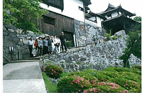
—広兼邸の巨大な石垣—