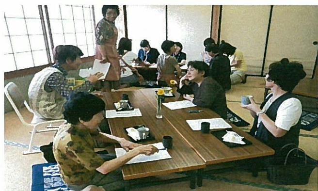
—なごやかにお話がはずみます—

時には、小さなお子様がいったり、中学生のお手伝いさんがいたり、とても穏やかな気持ちになりますよ。福祉推進員一同心を込めてお待ちしております。どうぞお出かけください。