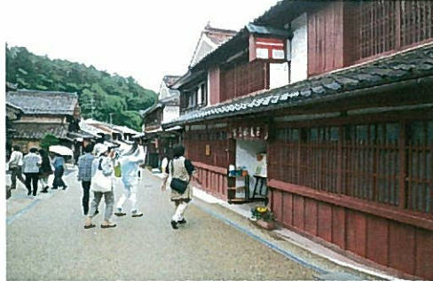
—吹矢ふるさと村での散策—